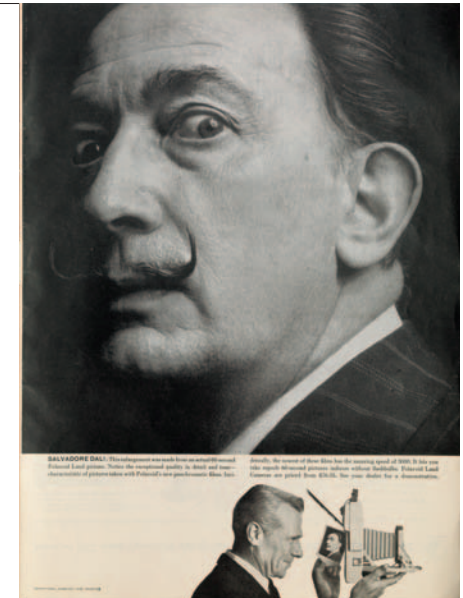
[Polaroid Land Cameras], Life , 11/04/1960