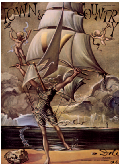
Status, 11/1965 Town & Country, 08/1945