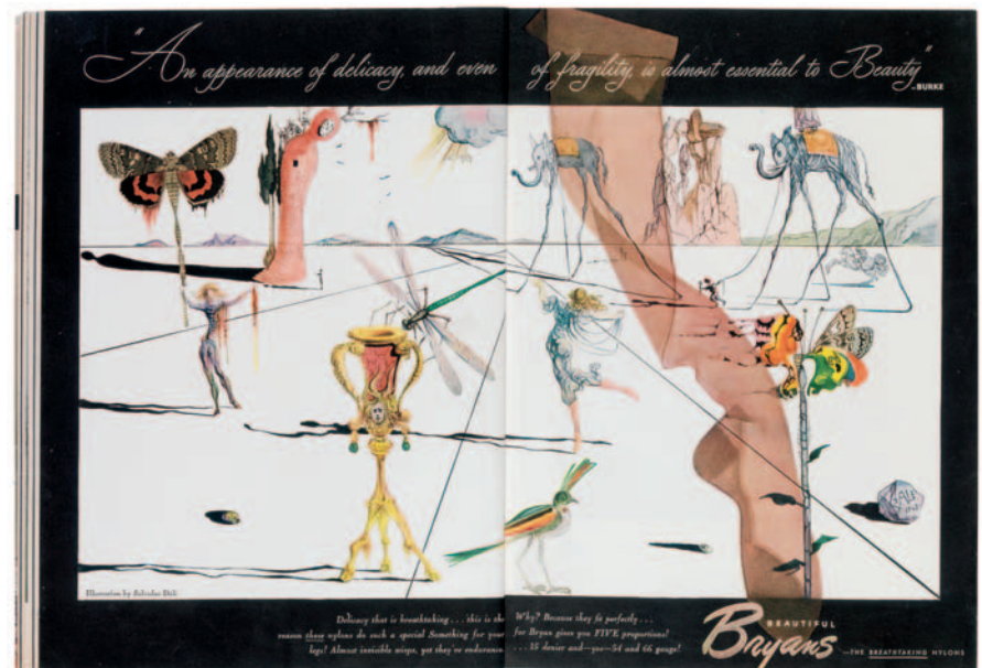
[Bryans Hosiery], Vogue , 01/05/1947