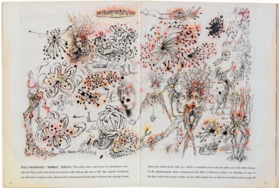
“Dali prophesies ‘mobile jewels’, Vogue , 01/01/1939