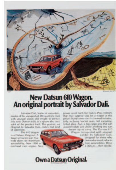
[Datsun], Time , 08/01/1973

Con la voluntad de reflejar esta intensa y vehemente intervención de Dalí en la prensa escrita, presentamos esta exposición siguiendo la estructura de las revistas, comenzando por las portadas, prosiguiendo con los artículos interiores, los anuncios y, para finalizar, el diseño total: el ya mencionado Dali