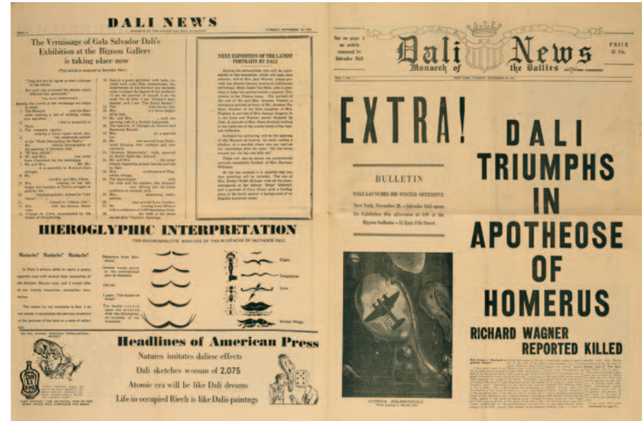
Dali News, 20/11/1945

Su obra se diversifica en esta etapa americana, cuando Dalí es ubicuo en las revistas, tanto él mismo como personaje y representante de una forma de hacer y de ser —extravagante, como se le define en líneas generales—, como con su obra. Durante estos años se consolida la imagen del artista que él mismo ha ido construyendo. La prensa lo considera el líder del surrealismo, el profeta del subconsciente, del mundo de los sueños y de la imaginación, el inventor del método paranoico-crítico, el hombre libre de pensar incluso lo impensable. A la vez que se le considera un hombre de su época, un representante de su tiempo, con influencia en el gusto contemporáneo. Pocas críticas de este momento analizan de forma seria la evolución de su obra. Dalí ya es un icono. En este sentido, resulta interesante la reflexión que nos propone Alain Juffroy en el año 1957 en la revista Nugget : «A pesar de esta mezcla irritante de audacia, genio, conformismo y presunción... Dalí mantiene ciertos valores que están por encima de ella: uno se ríe menos al escucharle cuando recuerda que cada una de sus bufonadas pone el dedo directamente en la llaga de nuestra historia.»