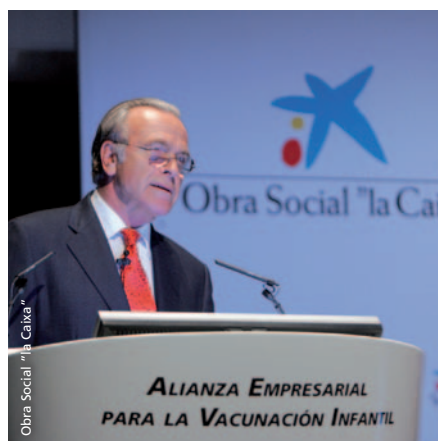
Isidro Fainé, en la presentación de la Alianza Empresarial en Madrid en enero de 2009.

Desde su inicio, más de 140 empresas han colaborado con la ALIANZA EMPRESARIAL PARA LA VACUNACIÓN INFANTIL , realizando aportaciones por un importe de casi 700.000 €.